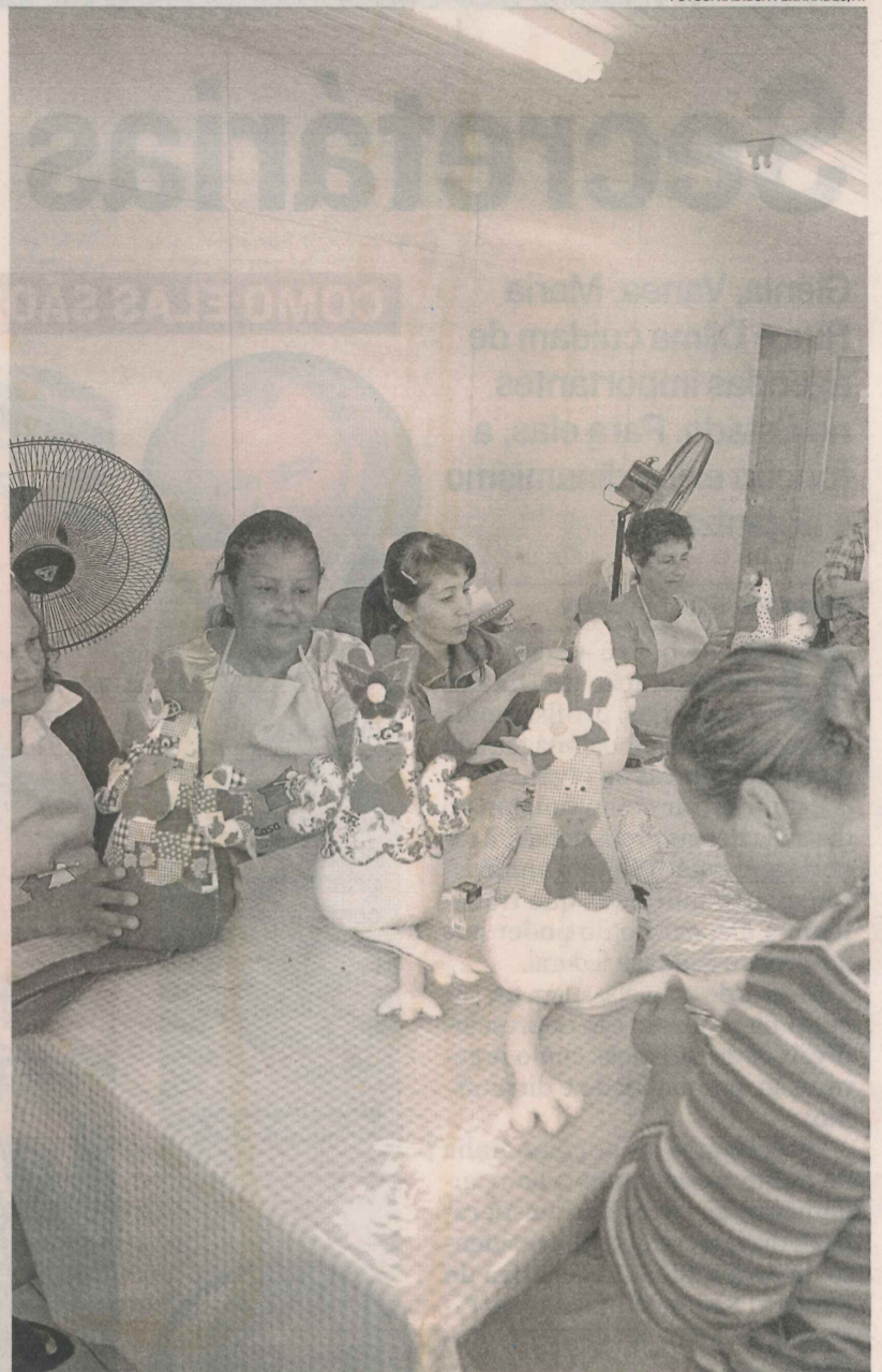
MORADORAS também fazem artesanato com feltro na Casa da Mulher

Para participar dos cursos basta ir até a Casa da Mulher e se inscrever. Os programas têm duração média de três meses, e são de graça. Para 2012, também serão oferecidos cursos de informática.