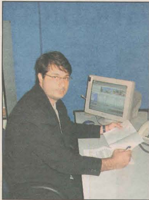
Dallapícula orienta o consumidor a exigir a identificação profissional do corretor. FOTO: