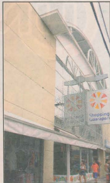
Fachada do shopping, que virou referência de lazer em Guarapari

Na alta temporada, o shopping abre em horário especial, pois é maior o movimento, circulando pelo local até 50 mil pessoas por dia. Além de visitantes da própria cidade, o Shopping recebe muitas pessoas de localidades vizinhas.