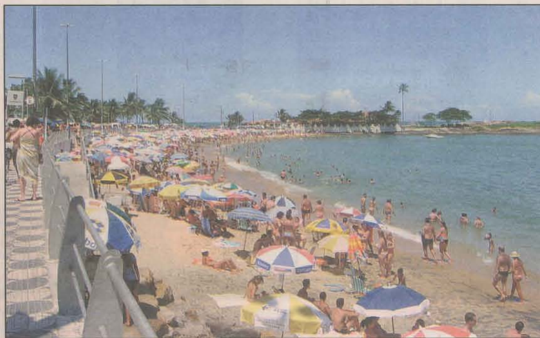
Praia da Areia Preta e suas areias "milagrosas".

Para o secretário, quando se trabalha com o resgate turís-