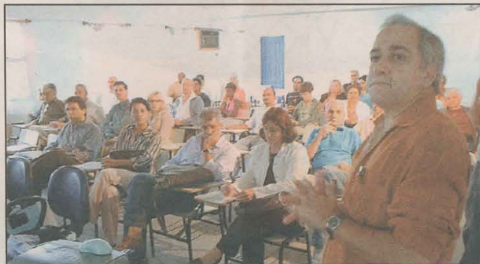
Reunião do PDM. Sociedade discute formas de ordenar o crescimento previsto.

Para a região sul da Grande Vitória, por exemplo, ele cita grandes projetos, entre os principais, os investimentos são a duplicação do mineroduto e a ampliação da base industrial da Samarco, a ampliação e diversificação de atividades no Porto de Ubu, a construção da Ferrovia Litorânea Sul, a construção do gasoduto entre Vitória e