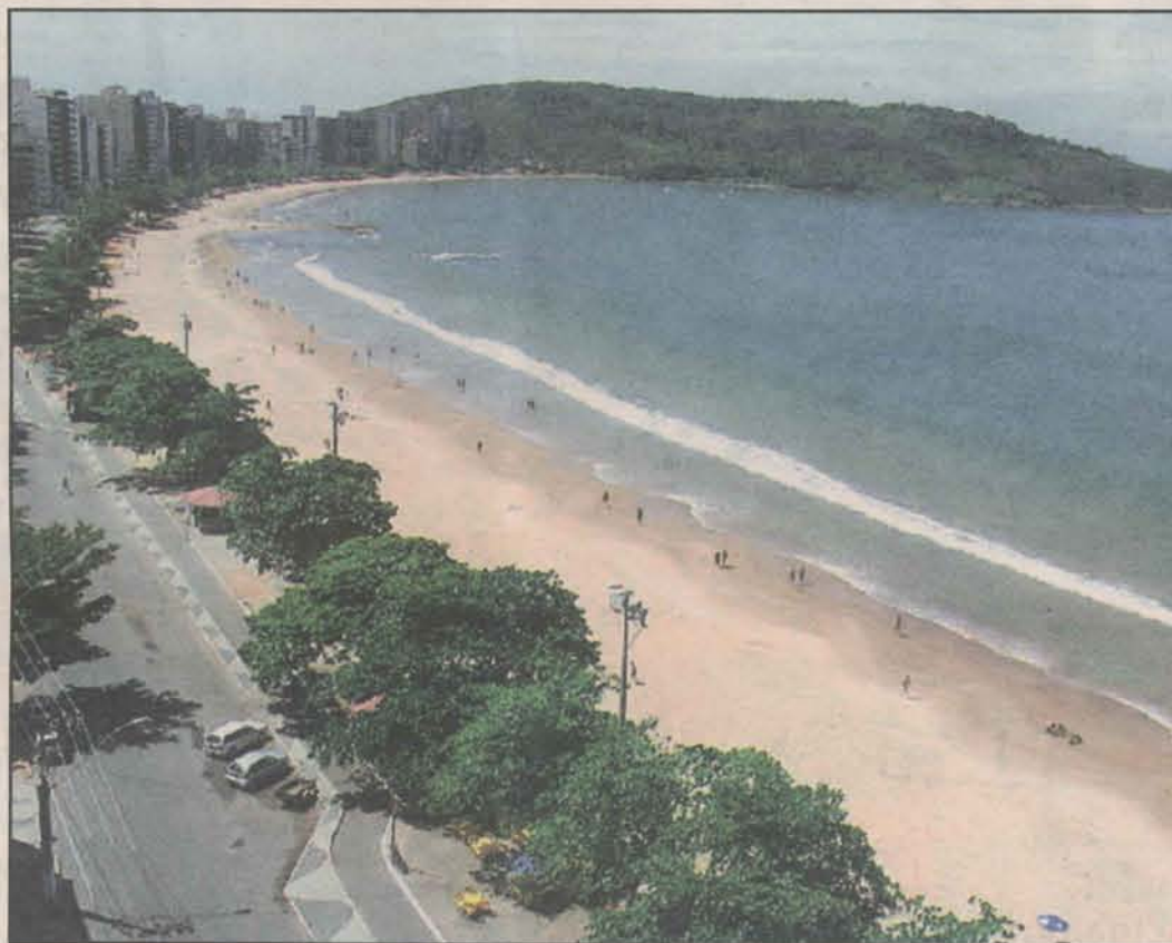
A Praia do Morro ganhará uma arena com espaço para apresentações de práticas esportivas.

A Arena Verão, por exemplo, será instalada na av. Beira Mar, no final da Praia do Morro, e terá um palco para apresentações de práticas es-