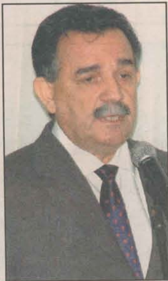
Galvão: a cidade voltou a falar, a discutir e a respirar turismo

No final da década de 70, a cidade de Guarapari começou a viver um fenômeno de transfiguração urbanística, depois de um longo período de ascensão turística e crescimento econômico. Com a expansão do setor imobiliário, associado à ex-