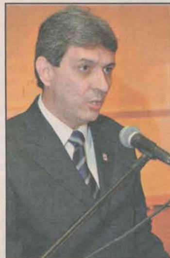
Costa: proprietários estão supervalorizando seus imóveis

Por esses motivos, hoje não se pode mais falar em Guarapari sem se falar no município de Anchieta; além de serem vizinhos os dois municípios, há uma concentração de investimentos muito grandes que vão para Anchieta, cujas