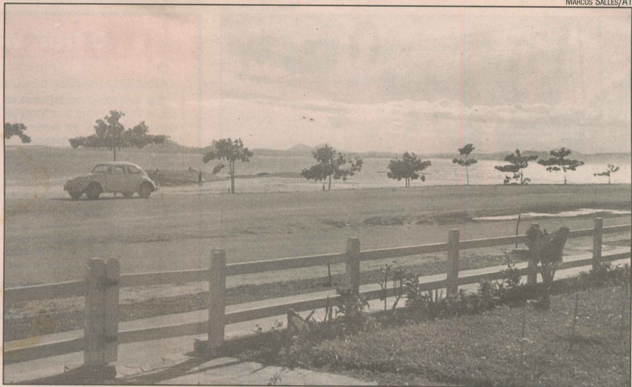
Em 1972, o bucolismo da região começava a ser ameaçado pelos primeiros moradores

Uma das obras mais importantes para o bairro, segundo a comunidade, foi o saneamento básico e o asfaltamento de algumas ruas.