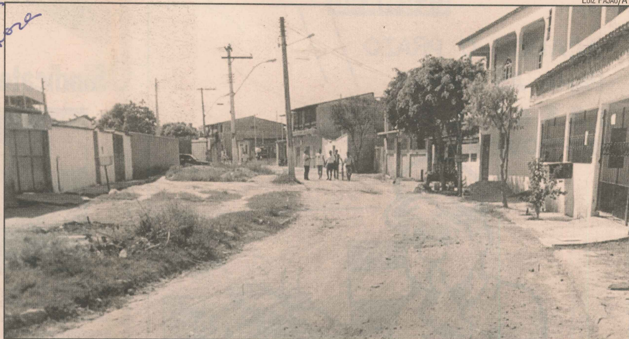
Na rua Eucalipto, a falta de pavimentação provoca o acúmulo de poeira

Buracos, bueiros sem tampa, poeira e falta de iluminação pública são os problemas apontados pelos moradores