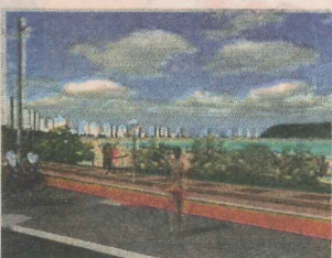
PRAIJA DO MORRO lotada de banhistas e maquetes do projeto de reurbanização. Obras vão começar no verão

ser alterado antes que o projeto seja concluído, de acordo com a prefeitura do município.