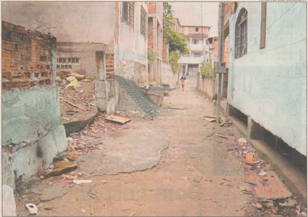
Rua do bairro Hélio Ferraz sem pavimentação e placas que identifiquem números das casas

Violência que começou a perturbar o bairro