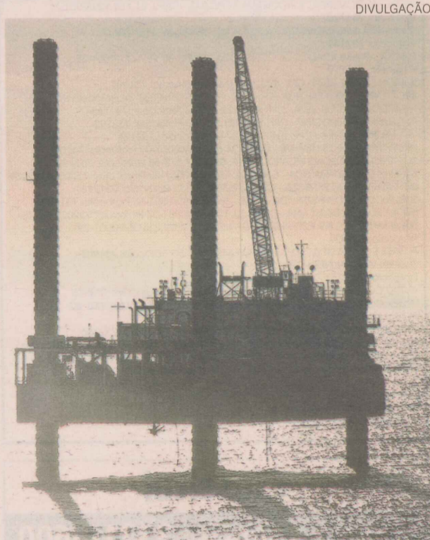
Área de petróleo vai qualificar 3,2 mil no Estado

A previsão é de que em 2013 comece a funcionar, quando mais de 6 mil vagas