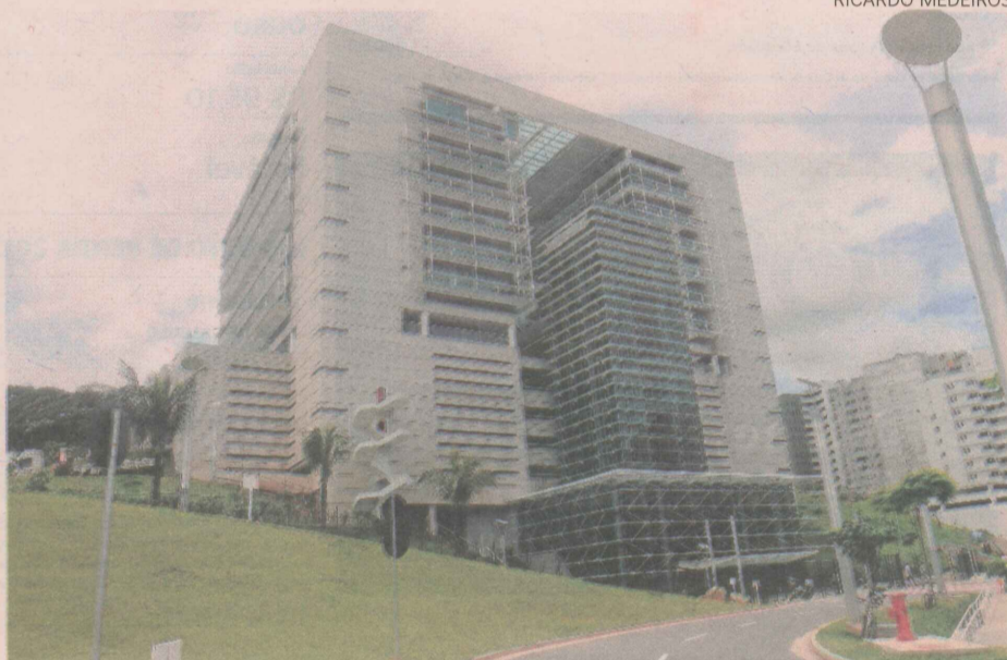
Obras na nova sede da Petrobras em Vitória demandaram R$ 500 milhões

Apesar de o Instituto Estadual do Meio Ambien-