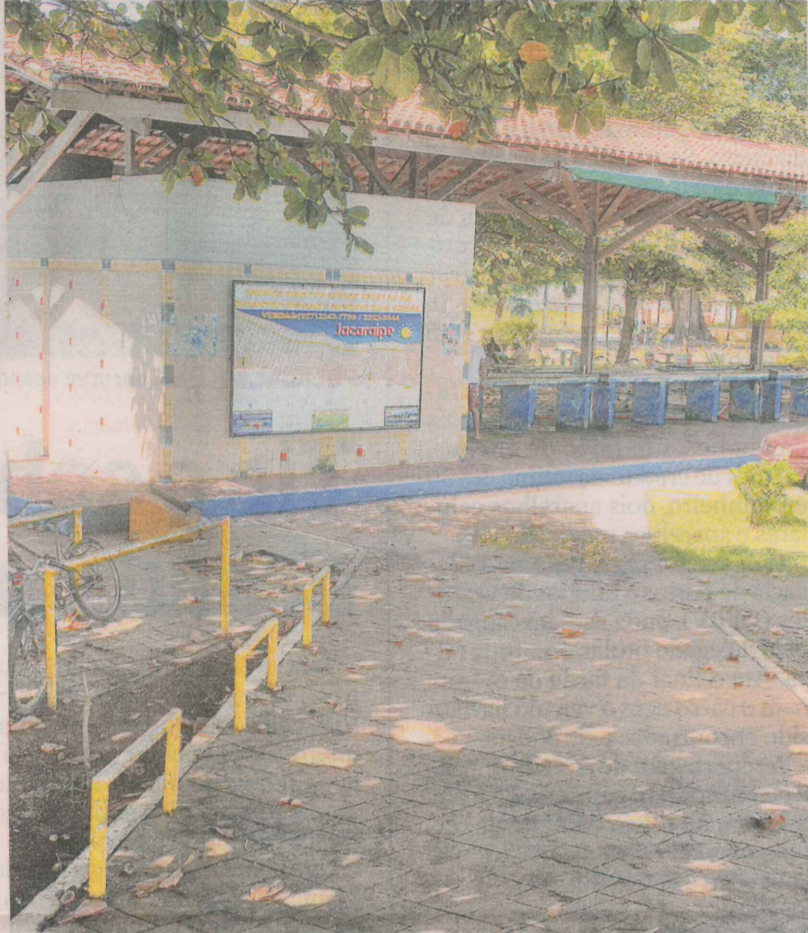
PEIXARIA MUNICIPAL, em Jacaraípe, abandonada e sem manutenção