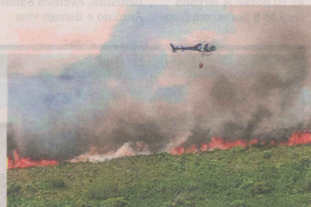
Locais como a Praia do Morro, a oito quilômetros do parque, foram encobertos pela fumaça; helicóptero da Polícia Militar ajuda no combate ao fogo