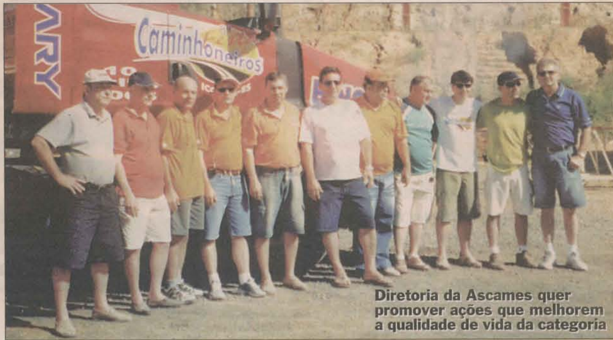
Diretoria da Ascames quer promover ações que melhorem a qualidade de vida da categoria

Na ocasião estarão presentes o governador do Estado, Paulo Hartung; o sub-secretário de Estado da Indústria e Serviço da Secretaria de Desenvolvi-