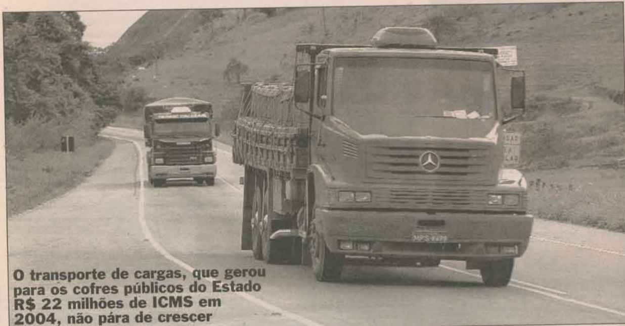
O transporte de cargas, que gerou para os cofres públicos do Estado R$ 22 milhões de ICMS em 2004, não pára de crescer

A metodologia do trabalho é desenvolvida, por meio da formação de diferentes grupos de trabalho, que vão apresentar soluções para problemas comuns. Os primeiros grupos priorizaram os temas Direito Trabalhista, Legislação Tributária, Gerenciamento de Risco, Questões Relativas ao Licenciamento de Veículos e Entrega de Mercadorias a Grandes Clientes.