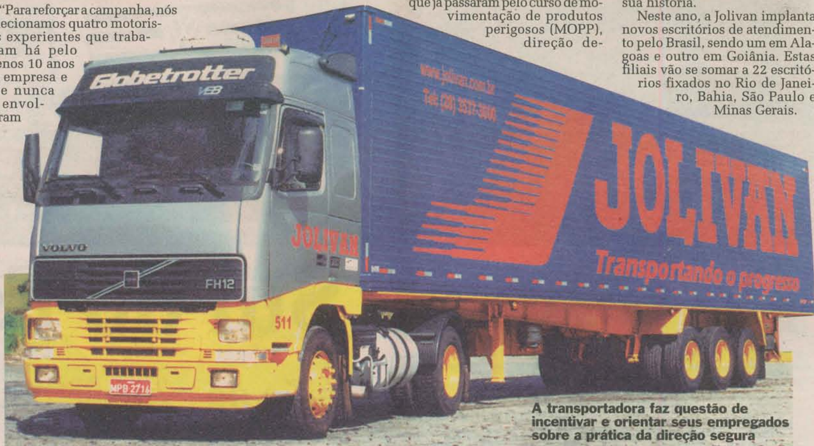
A transportadora faz questão de incentivar e orientar seus empregados sobre a prática da direção segura

Neste ano, a Jolivan implanta novos escritórios de atendimento pelo Brasil, sendo um em Alagoas e outro em Goiânia. Estas filiais vão se somar a 22 escritórios fixados no Rio de Janeiro, Bahia, São Paulo e Minas Gerais.