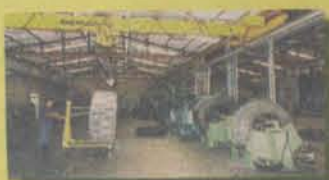
PNEUS FORA DE ESTRADA