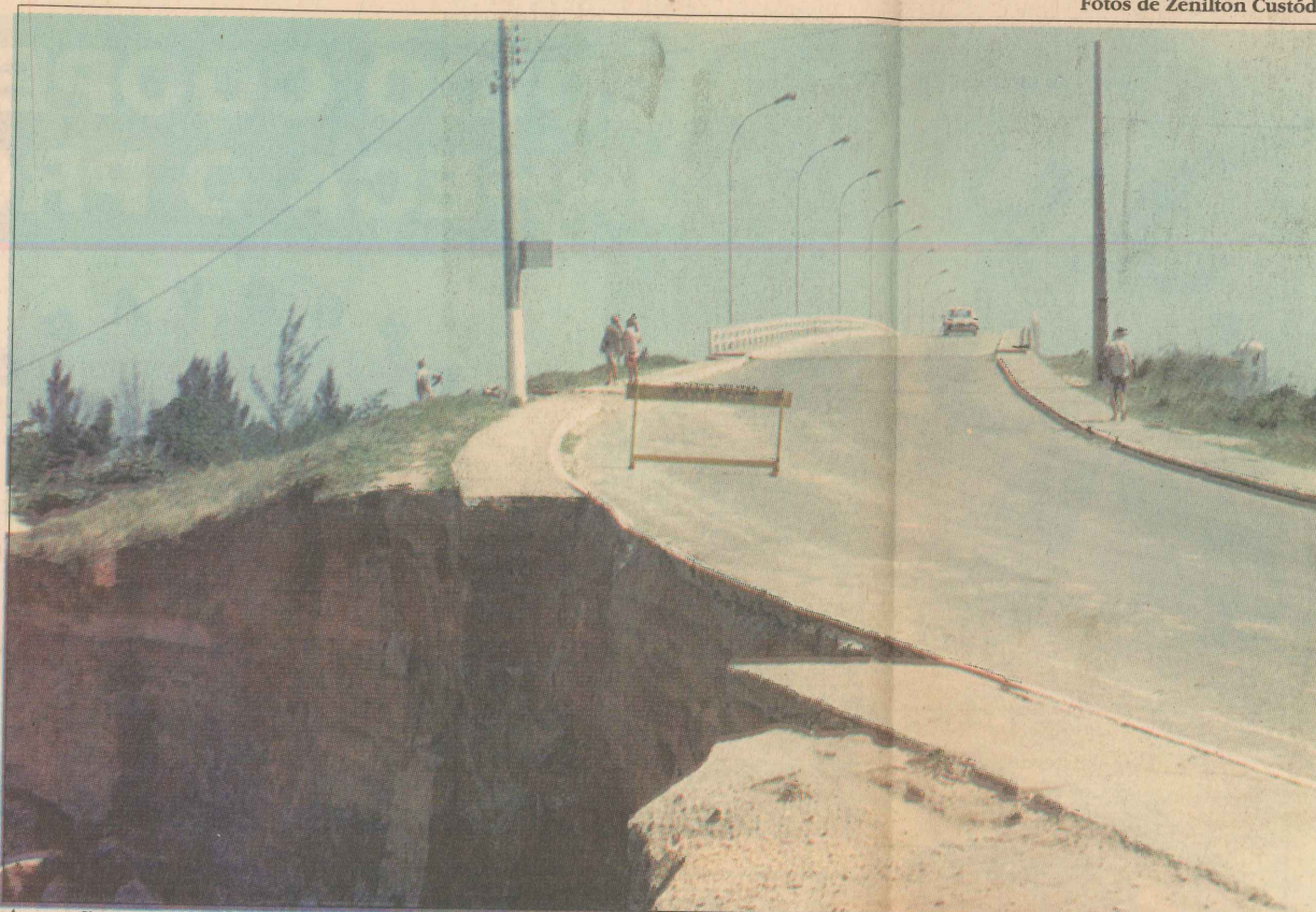
A erosão provocada pela maré já está colocando em risco uma pista da Rodovia do Sol, entre Marataízes e Itaoca

A destruição promovida pela maré em Pontal, que se transformou em uma espécie de atração turística, já foi levada ao conhecimento do governador do Estado, Vitor Buaiz. O deputado Benedito Eneas (PFL), que reside no município, informou que encaminhou um ofício ao Governo solicitando providências. Entretanto, segundo informações do secretário de Obras, até quinta-feira à tarde a Prefeitura não havia obtido nenhuma resposta. João César Marino alertou para a necessidade de serem adotadas medidas emergenciais para conter a ação da maré, acrescentando que parte da pista da Rodovia do Sol já foi interditada para evitar acidentes.