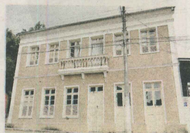
CASARÃO DOS VIOLINOS – Construído em 1925, hoje abriga cursos de luteria.