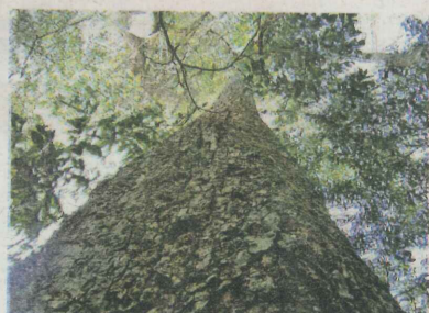
JEQUITIBÁ-ROSA – Fica na região de Alto Rio Ubás, a 30 km da sede. Tem 800 anos e 47m de altura, além de 12,7m de circunferência.