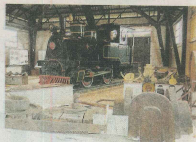
MUSEU FERROVIÁRIO – Inaugurado em 1955, tem como atrativos uma locomotiva a vapor, fotos e 1.200 fichas de ex-ferroviários.