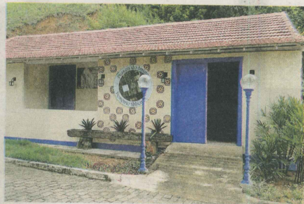
CASA DA MEMÓRIA – O imóvel já abrigou uma escola. Nesse local passará a funcionar um museu que resgata a história e tradições de Demétrio Ribeiro.