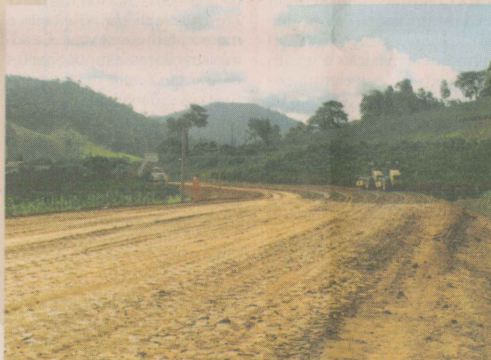
Obra de pavimentação da Rodovia entre Laranja da Terra e Itarana, via Joatuba.

A rodovia será um importante meio de escoamento da produção agrícola que é a principal fonte de economia municipal. Por isso as comemorações de 23 anos de emancipação são ainda mais especiais com mais essa conquista da comunidade.