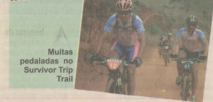
Muitas pedaladas no Survivor Trip Trail