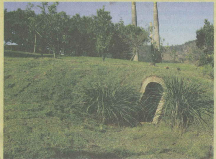
Gruta da 2ª Guerra Mundial localizada ao lado da Igreja Luterana da Vila de Laranja da Terra

Laranja da Terra se liga de alguma forma com a Segunda Guerra mundial. Colonizada por imigrantes pomeranos, o município tem forte influência da igreja luterana, com algumas paróquias e comunidades com mais de um século de instaladas, como por exemplo a Paróquia Luterana de Vila de Laranja da Terra, que em 2011 completou seu primeiro centenário de existência. E é justamente nas proximidades desta igreja que se encontra a ligação de Laranja da Terra com a segunda guerra.