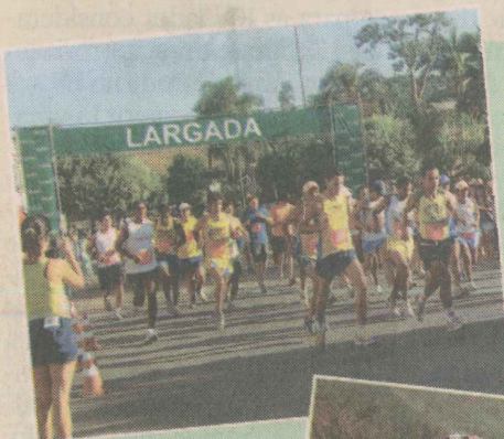
Largada da Ultra Maratona dos Cinco Pontões.

encantadoras, com clima ameno e natureza preservada. De acordo com os laranjenses, quem vem a cidade sempre volta por causa de seus encantos e suas belezas.