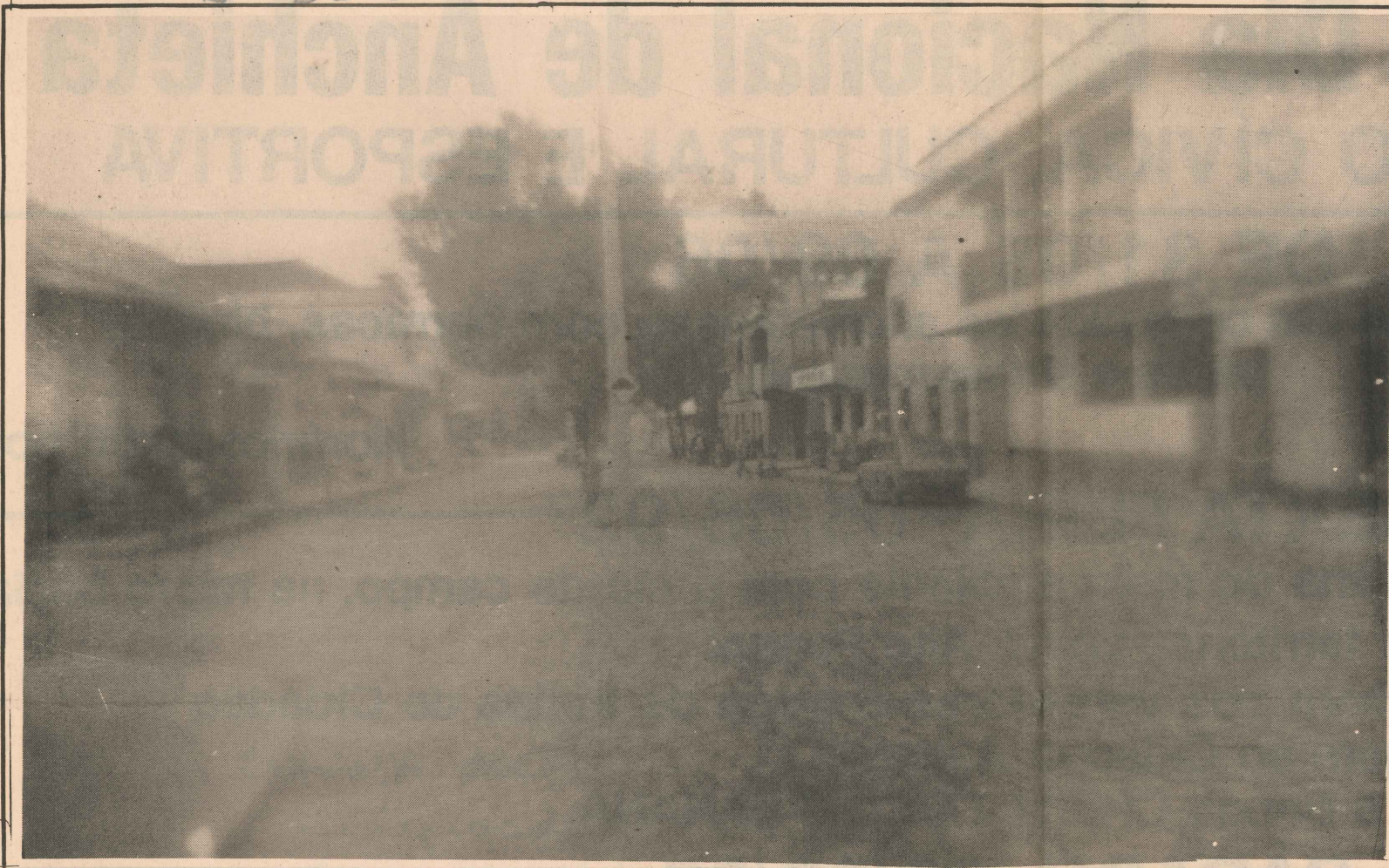
Parte dos equipamentos: já comprados, aguardando apenas o restante da verba