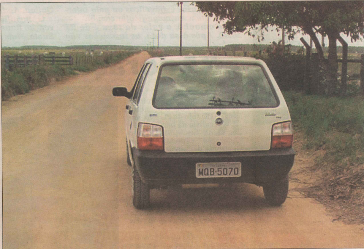
Estrada do distrito de Córrego Farias, que vai ser asfaltada no ano que vem

De acordo com ele, o custo médio do quilômetro asfalta-