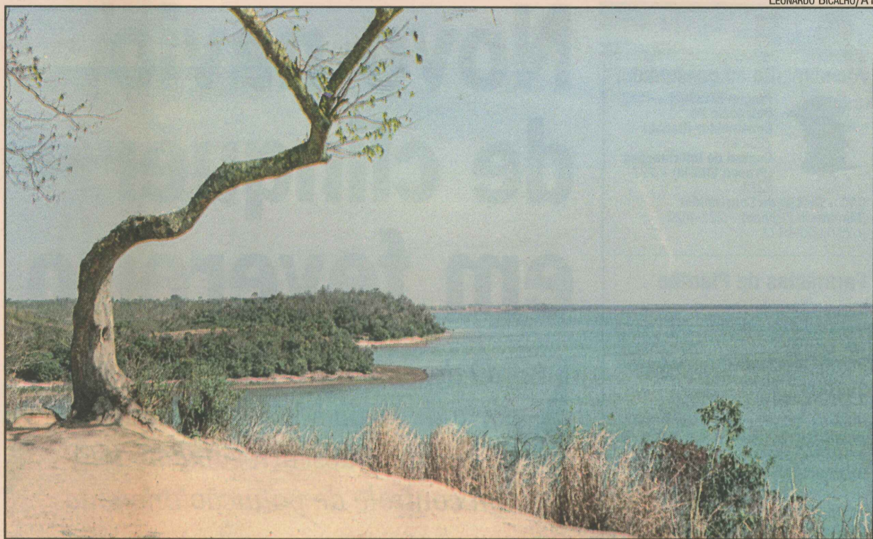
A lagoa Juparanã é a 2ª maior em extensão no País e a primeira em volume de água doce

Há 45 quilômetros da cidade, a praia abriga diversos tipos de mamíferos e aves. Nos fins de semana e férias, a beleza natural da praia é responsável pelo deslocamento de famílias linharenses para o litoral. São mais de três mil casas de veraneio construídas na região.