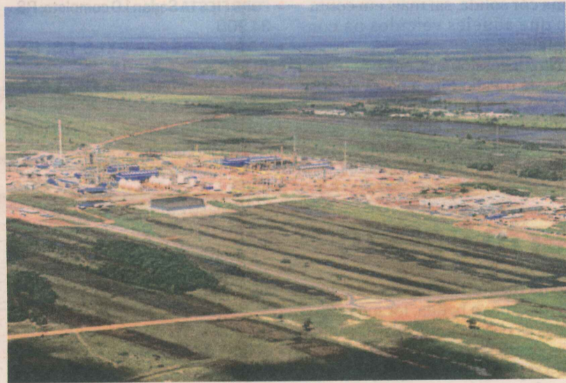
INSTALAÇÃO da Petrobras em Cacimbas: grandes investimentos na cidade