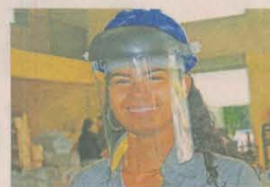
EQUIPAMENTOS evitam acidentes

Eles permanecem um ano e meio na empresa e conhecem todos os procedimentos administrativos da fábrica.