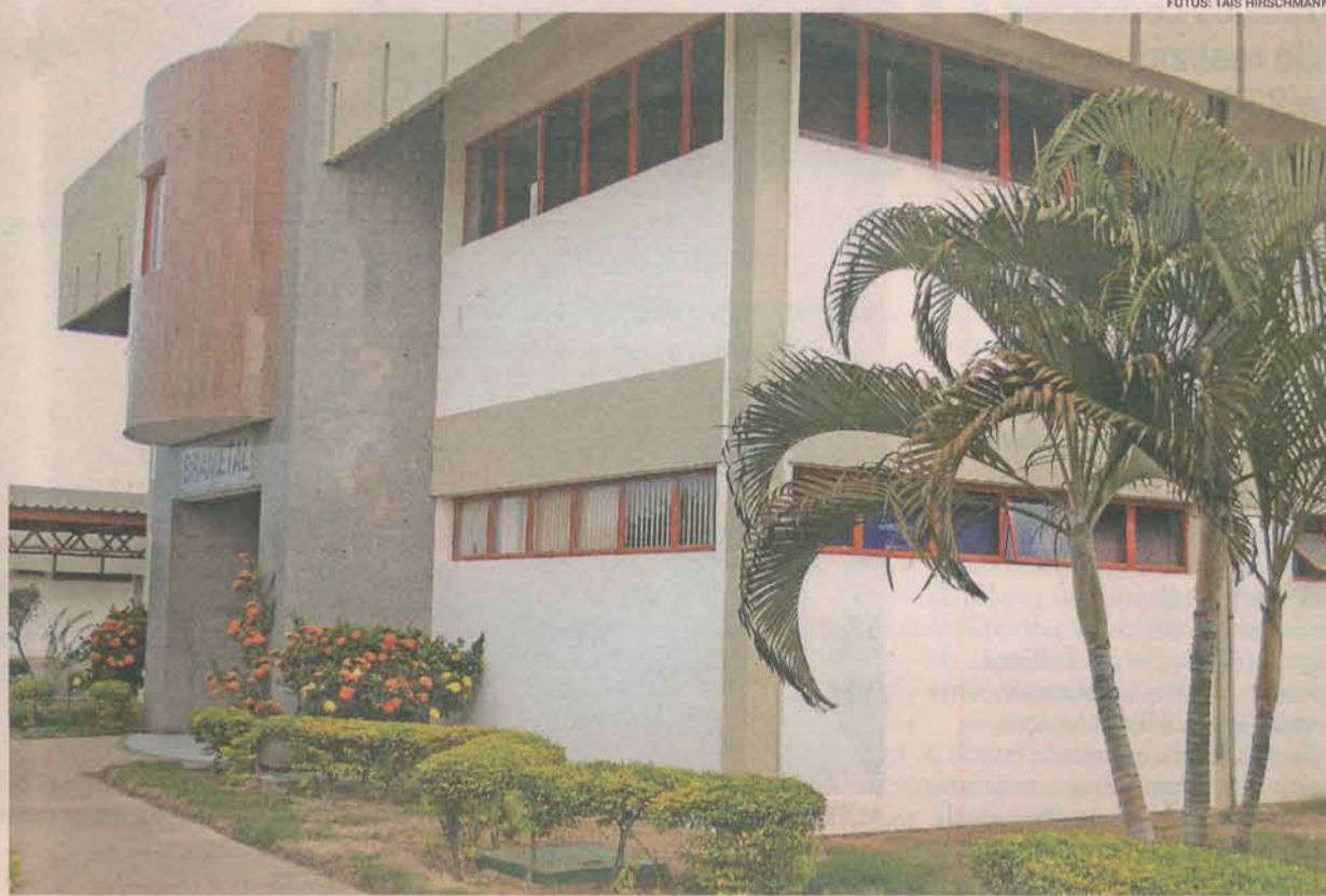
FÁBRICA DE ESTRUTURAS METÁLICAS está instalada na BR-101, em uma área de 208 mil metros quadrados

Com estes objetivos e utilizando os recursos humanos e tecnológicos de que dispõe, a Brametal vem desenvolvendo soluções estruturais inovadoras para linhas de alta e baixa tensão.