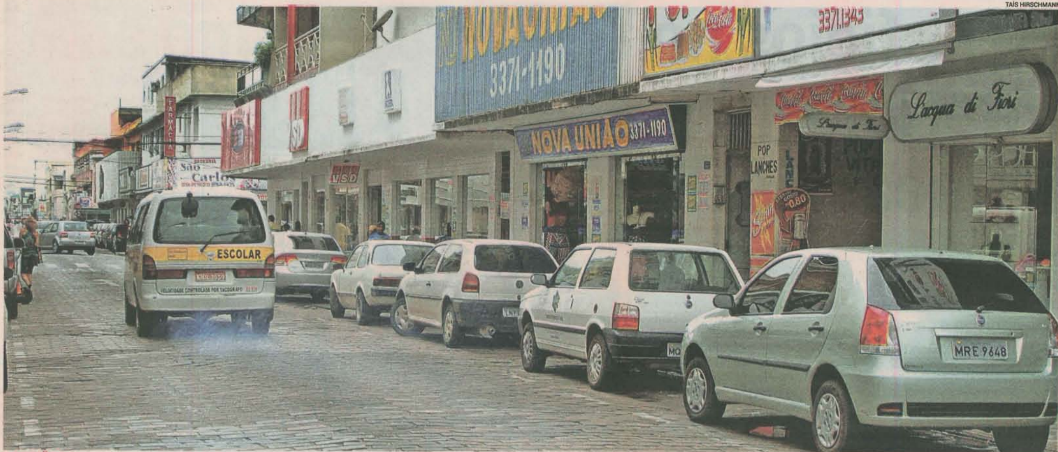
A REGIÃO 1, que compreende os bairros Centro (foto), Nossa Senhora da Conceição, Juparanã e Três Barras, vai ganhar reforma de praça, novo posto de saúde, além de centro de recuperação