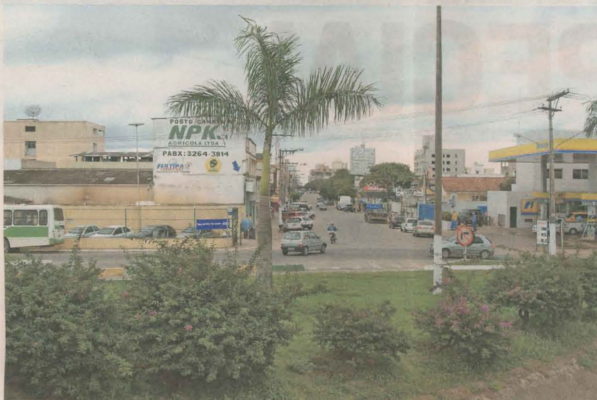
MORADORES de Linhares serão beneficiados com pacote de obras e melhorias anunciadas pela prefeitura