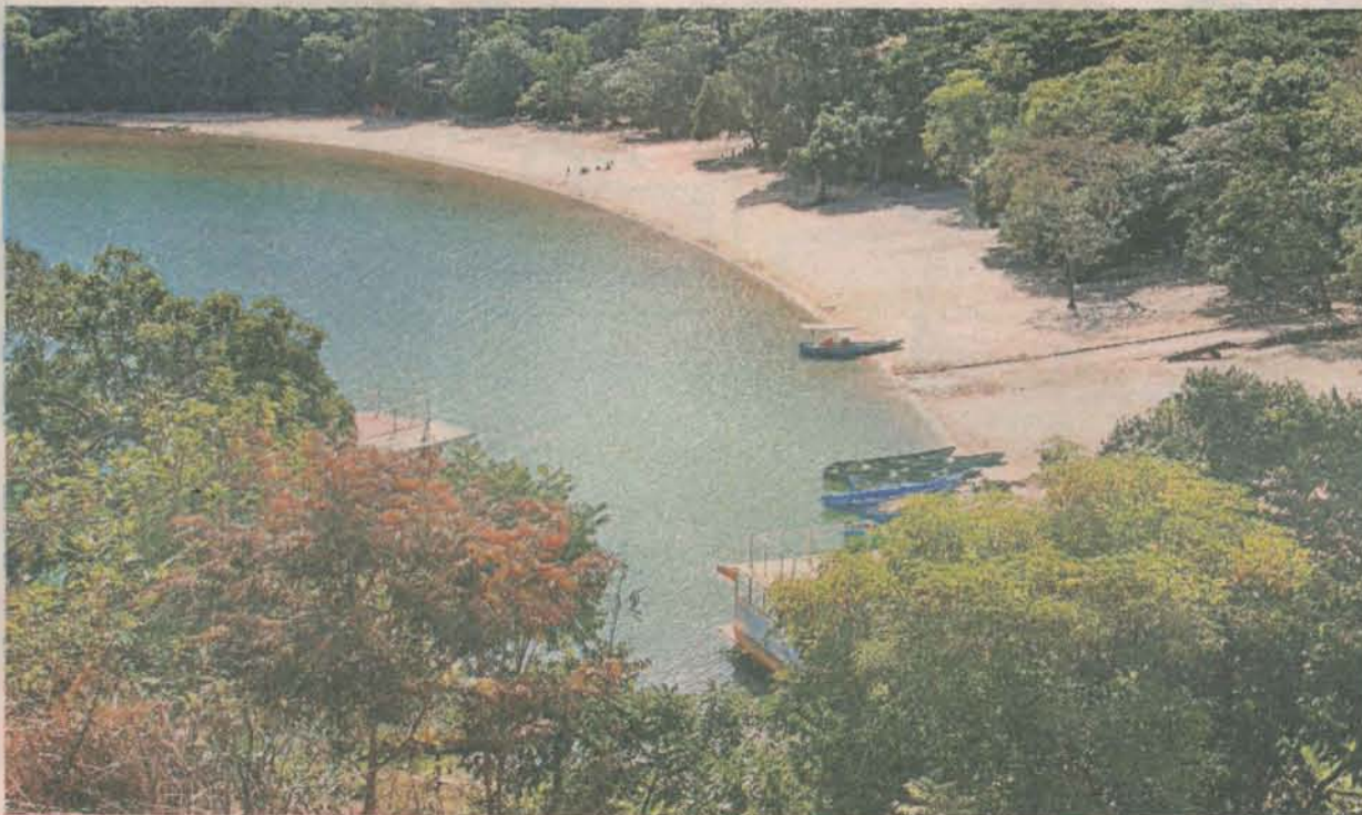
OBRA visa o desenvolvimento sustentável voltado para o bem estar da população e a preservação da natureza

O programa de saneamento está sendo levado também para a localidade de Povoação, para onde serão repassados ao SAAE aproximadamente R$ 650 mil para sistemas de esgotamento sanitário.