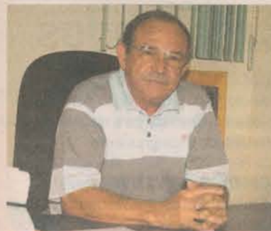
PERINI: novas salas cirúrgicas

Ao todo, a instalação da UTI Coronariana vai custar cerca de R$ 650 mil, mas o hospital pretende pleitear recursos junto ao Governo