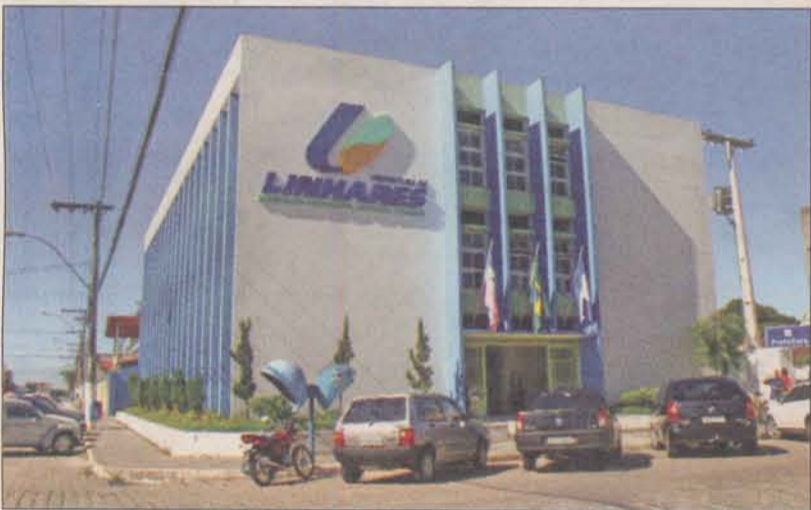
Prefeitura investe em inúmeras obras por todo o município

Juntamente com seus 112 mil habitantes, a atual administração aposta numa cidade com qualidade de vida e oportunidade para todos. Para isso, nem mesmo em clima de festa, o trabalho rumo ao progresso é deixado de lado.