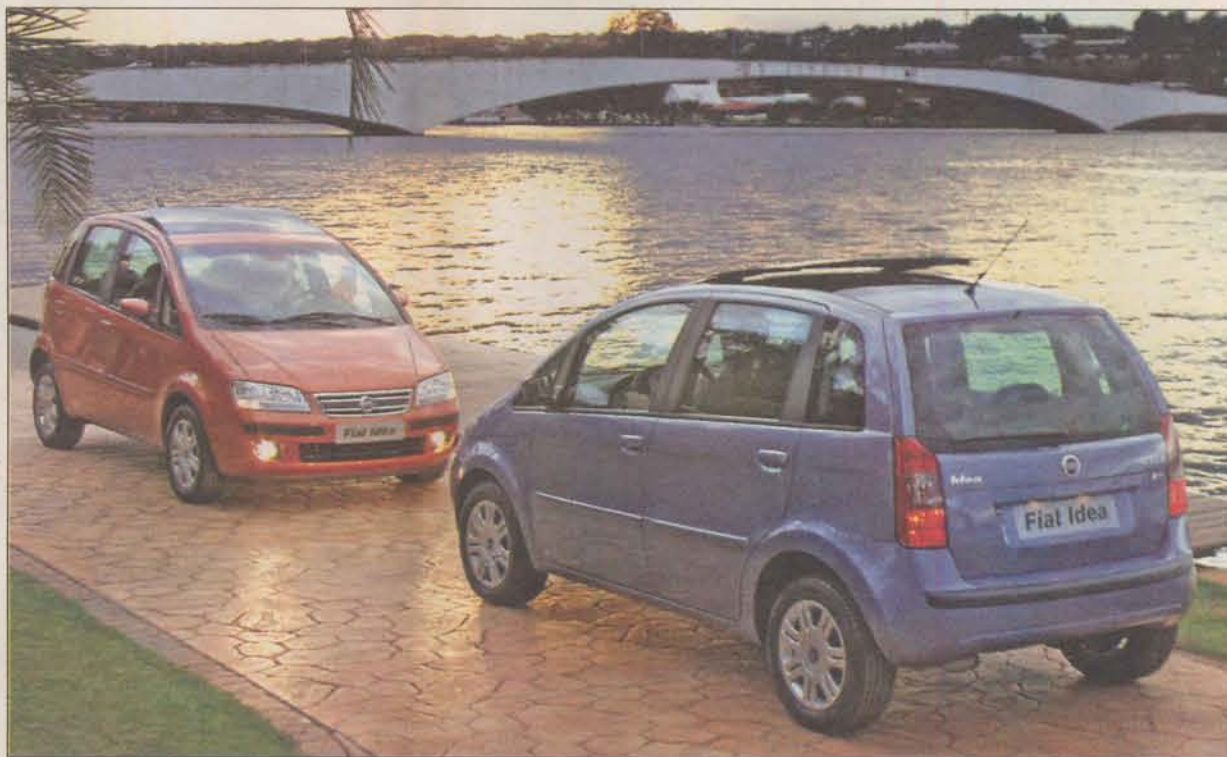
A Fiat premiou a MVC como uma das 25 concessionárias com melhor desempenho no País

Como reconhecimento desse trabalho, o Programa de Excelência da Fiat, lançado em 2003, premiou a MVC Veículos como