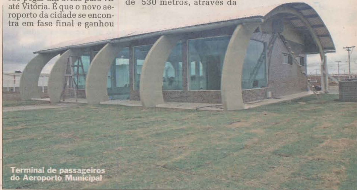
Terminal de passageiros do Aeroporto Municipal

Há também a possibilidade de implantar vôos semanais na rota São Paulo, Juiz de Fora e Mucuri. O preço médio da passagem deve ser de aproximadamente R$ 500,00.