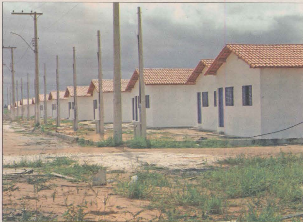
A meta da prefeitura é entregar cerca de mil casas até o final deste mandato

Os investimentos são da ordem de R$ 2.247.800,39, sendo R$ 1.760.254,80 do município e R$ 487.545,59 da Caixa Econômica Federal.