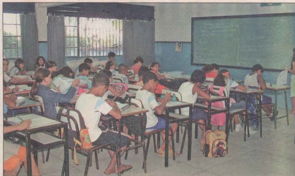
O número de alunos matriculados no ensino fundamental e na pré-escola passou de 14,7 mil para 25 mil

Para proporcionar mais conforto e segurança a alunos, professores e demais funcionários,