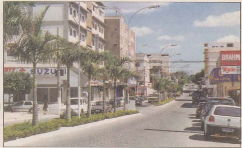
Empresas de diversos setores estão se instalando na região

A Trop Frutas, que vai implantar uma fábrica de polpa de frutas no município, é outro empreendimento de peso. Além dos 400 empregos diretos, mais de 15