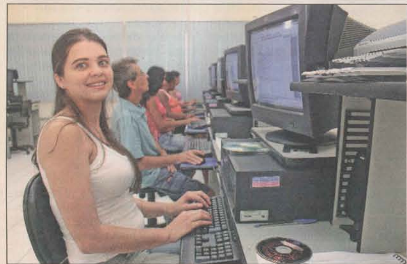
A Educação tem sido prioridade constante para a prefeitura

A nova sede do Centro Regional de Educação Aberta e à Distância (Cread) de Linhares está sendo construída no bairro Novo Horizonte. O investimento é de aproximadamente R$ 1,1 milhão. As obras estão bem avançadas. Mais de 80% do projeto já foi executado. O Cread deve ser entregue até o final de outubro.