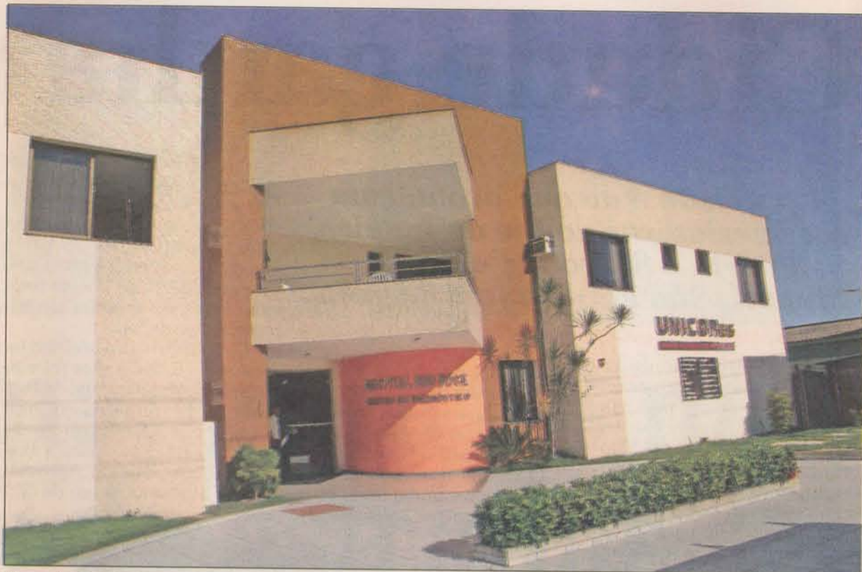
Hospital Rio Doce: credenciado para cirurgias cardíacas de alta complexidade

Para melhorar o atendimento nesses locais, o município contratou mais 190 médicos que, juntos somam agora 280 profissionais preparados para atender a população. Esse percentual estará atuando nas unidades de saúde e nos hospitais da cidade.