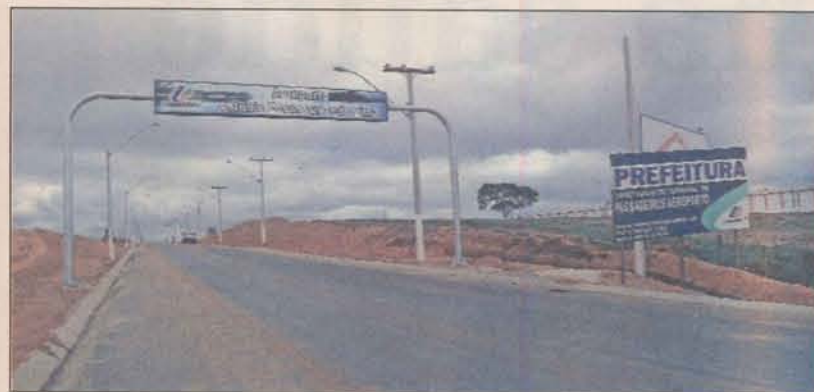
Acesso ao aeroporto pela BR-101