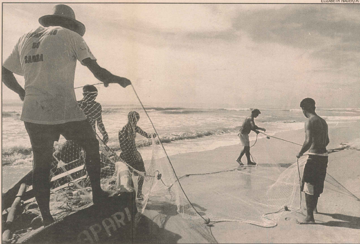
Na rede dos pescadores de Marataízes, desde dourado a robalo

Para o Carnaval, o pacote de cinco dias por pessoa na barraca custa R$ 40,00. Na suíte,