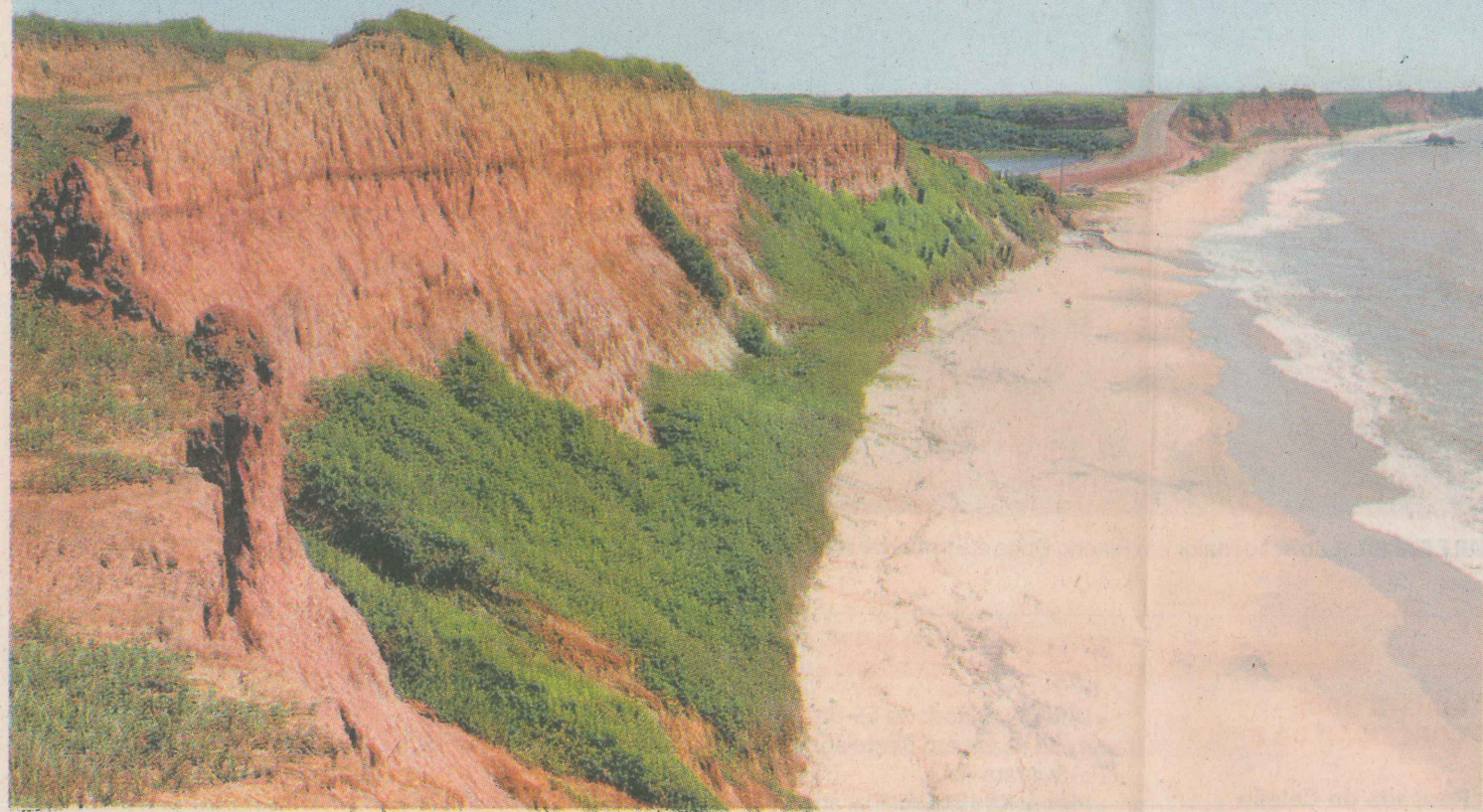
CARTÃO-POSTAL Em Marataízes, nem tudo é agito: as falésias se erguem imponentes ao lado do mar, na praia praticamente deserta

Texto ROSÂNGELA VENTURI /rventuri @redegazeta.com.br