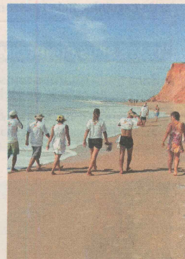
PARTICIPANTES em caminhada

Durante a caminhada, haverá retirada de lixo da praia. O passeio custa R$ 15, com direito a transporte até o início da caminhada, apoio, lanche e água. Os 200 primeiros inscritos ganham camisetas. Mais informações: 3515-1092 e 9915-6889.