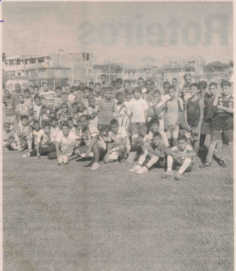
TURMA faz aula de futebol no campo do bairro. Ao todo, são 300 alunos

recido em parceria com o Senai, é o de Alimentador de Linha de Produção. O objetivo é formar profissionais para trabalhar em indústria de plástico e embalagens.