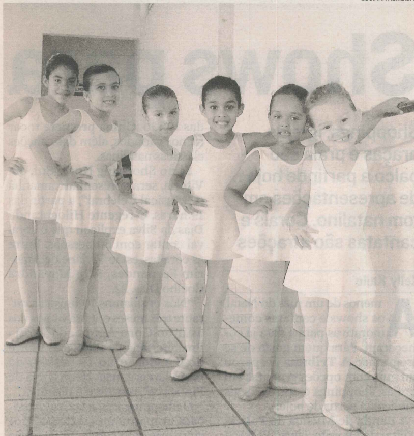
ALUNAS do curso de balé no bairro: matrículas nos dias 21 e 22 deste mês

Já quem quer obter uma bolsa de estudos na faculdade deve procurar a associação de moradores para ter mais informações.