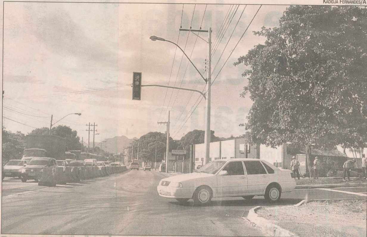
Foram instalados semáforos no cruzamento da rua Projetada com a Fernando Ferrari

Hoje começam a ser retirados os canteiros da rua Carlos Gomes de Sá. Motoristas podem ter acesso à Fernando Ferrari pela rua Projetada