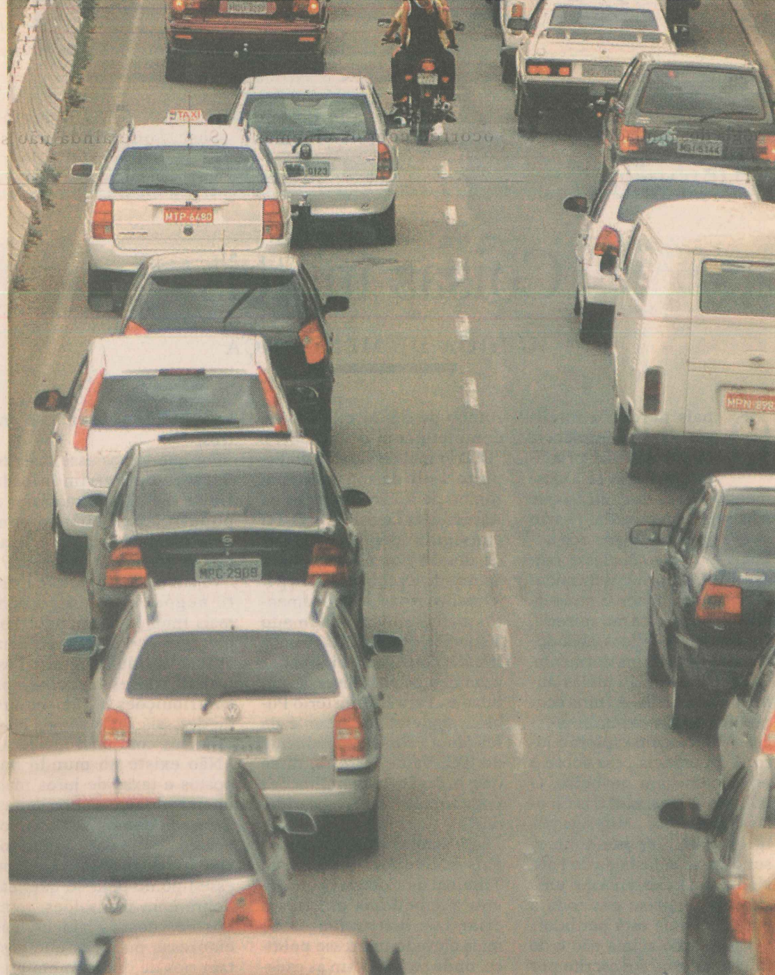
OBRA. A intenção da prefeitura é concluir a duplicação da Fernando Ferrari em 2006.

A prefeitura pretende concluir as obras de duplicação da Fernando Ferrari em 2006. No mesmo período, será realizada a licitação para construção da nova Ponte da Passagem, estimada em R$ 36 milhões. Uma parte da pedra que fica na entrada do bairro Mangue Seco terá que ser retirada, o que aumentou os custos