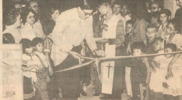
O prefeito inaugurando as novas instalações

A Comarca de Nova Venécia, criada a 18 de Fevereiro de 1956, é de 2º entrância. Também chamado de Pérola do Norte é o município dos mais privilegiados na região Norte do Espírito Santo, pela sua vida política, cultural, religiosa, comercial e social, pois aglutina em sua sede importantes repartições públicas, hospitais, escolas e comércio, possuindo excelente localização geográfica como centro polarizador do Norte do Estado.