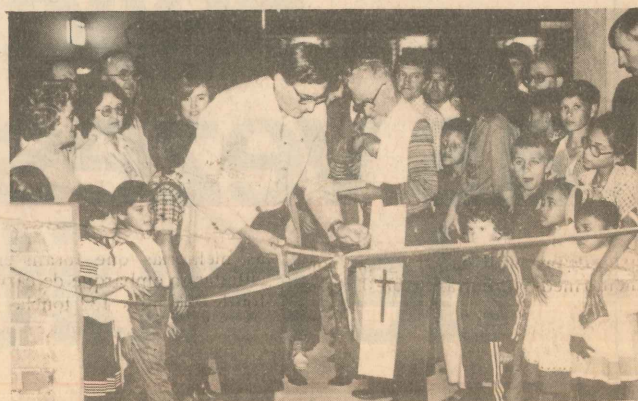
O prefeito inaugurando as novas instalações