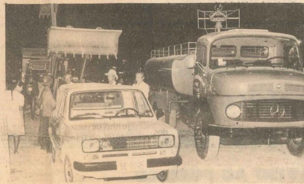
Equipamentos modernos foram adquiridos pela prefeitura

Dentro dos planos a serem realizados, em curto prazo, pela administração do prefeito Antônio Moraes, constam ainda a construção de uma praça denominada Praça Brasília, abaixo da Copnorte, e a construção do Horto Super-Mercado Municipal, cuja concorrência para construção já está aberta com várias propostas levadas à Prefeitura Municipal.