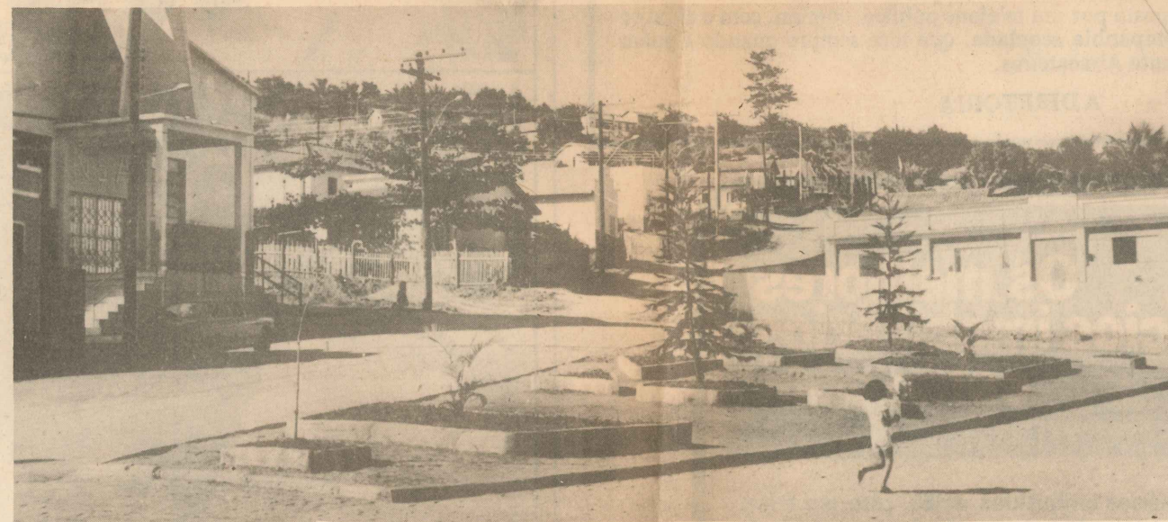
A praça de Aparecida: área de lazer para a comunidade

O dia 11 de Dezembro de 1953 marcou a emancipação política do atual município de Nova Venécia.