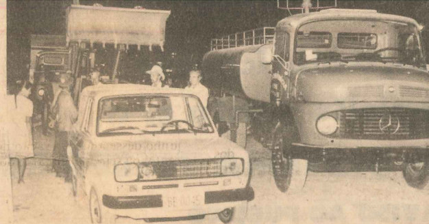
Equipamentos modernos foram adquiridos pela prefeitura

Entre estas obras se destacam a conclusão do calçamento da Avenida São Mateus, do Cremasco até a av. Antônio dos Santos Neves; a conclusão da Praça de