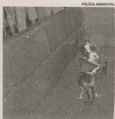
GALOS de briga foram apreendidos

A pena para quem promove a rinha é detenção de três meses a um ano e multa, que varia de R$ 500 a R$ 3 mil por animal apreendido.