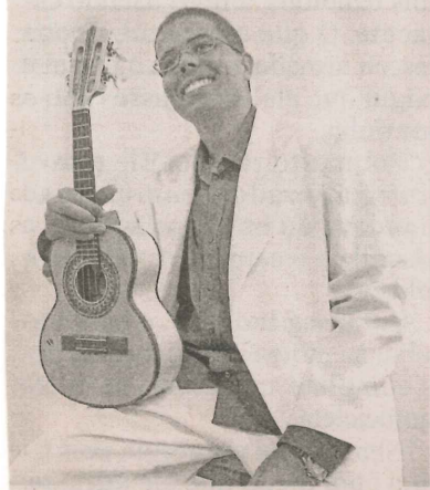
ROGERINHO DO CAVACO: show