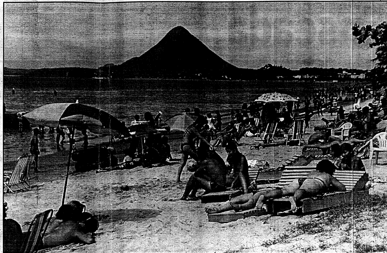
Turistas ficam encantados com a beleza do Monte Aghá, que tem 300 metros de altura

O terreno elevado possui formato de cone, 300 metros de altura e é próprio para vôos de asa-delta e alpinismo. “Os turistas gostam muito de lá, prin-