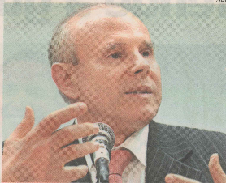
OTIMISMO. Guido Mantega está otimista com crescimento

tal Fixo (FBCF) subiu 6,5% no terceiro trimestre deste ano em comparação com o segundo trimestre, o que representou a maior alta ante trimestre imediatamente anterior apurada pelo IBGE desde o primeiro trimestre de 2006.