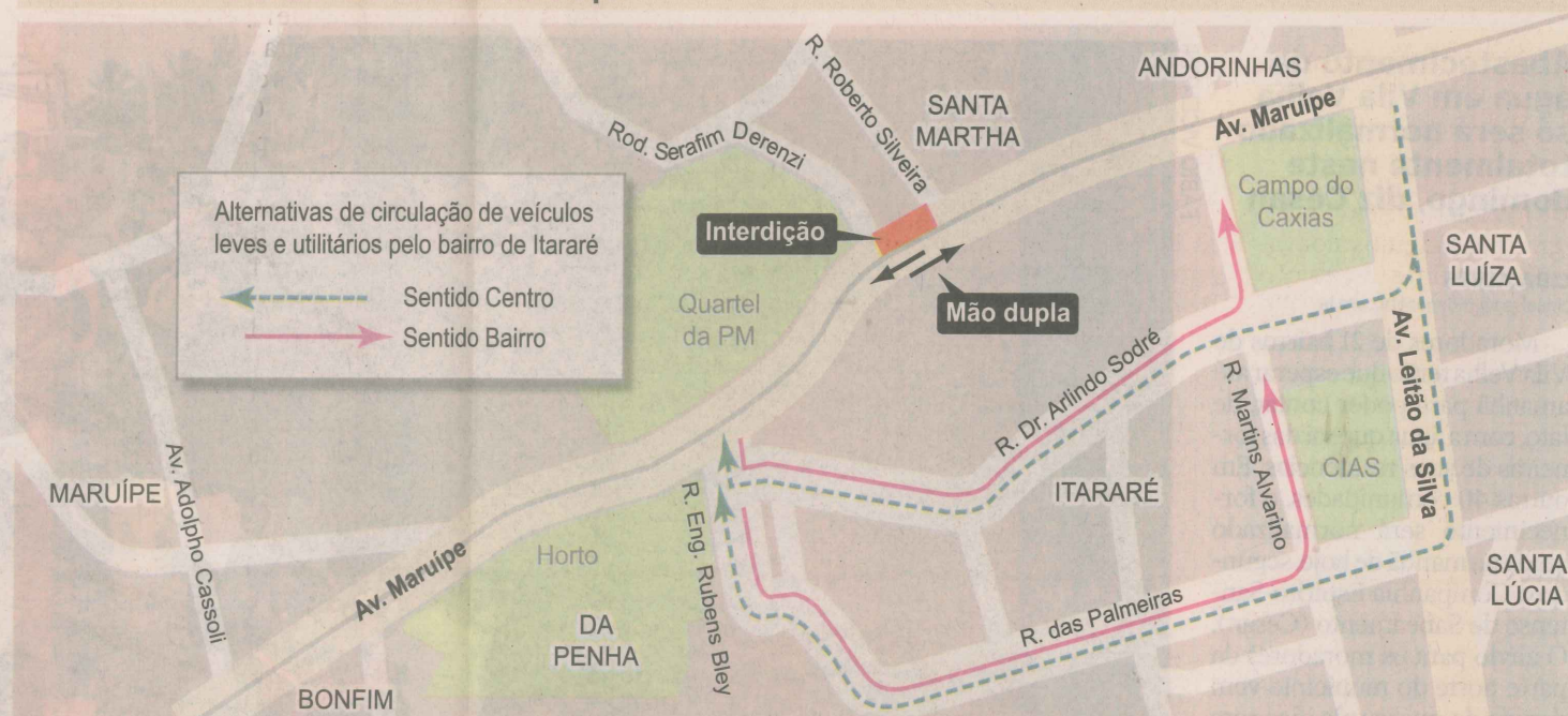
Como fica o trânsito na Avenida Maruípe

Outras quatro interdições estão previstas na cidade, nos bairros Mário Cypreste, Vila Rubim, Romão e Ilha de Santa Maria. Em Mário Cypreste, a Avenida Santo Antônio está parcialmente interditada desde ontem, até 8 de agosto. Na Vila Rubim, a Rua São Simão será totalmente interditada no trecho