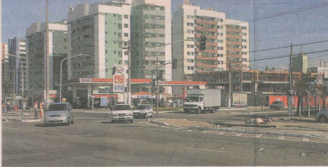
CONVERSÕES. Motoristas poderão sair da Adalberto Simão Nader para Camburi, mas não o contrário

“O desvio é uma via definitiva e já tem até nome. Será a entrada para a Avenida Adalberto Simão Nader. Essa alça passa a fazer parte do sistema viário de Vitória e daquele cruzamento. Essas alterações, considerando a alça e o sentido único no trecho da Simão Nader em direção à praia, vão permitir que o semáforo na Avenida Dante Michelini fique em duas fases e