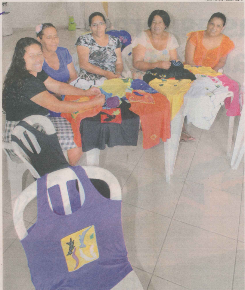
AS INTEGRANTES DO GRUPO mostram algumas das peças produzidas

Com apoio da Prefeitura da Serra, a venda das peças é feita em lo-