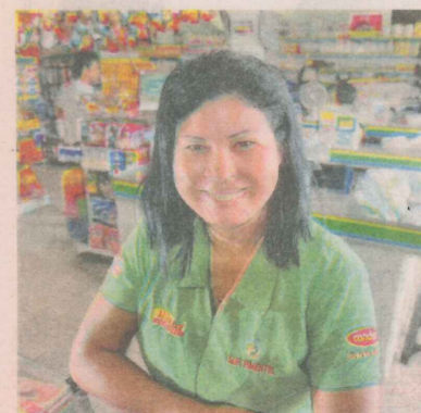
EDINAURA já teve uma sorveteria

"Percebemos que a venda de alimentos era boa, e investimos". O supermercado Pimentel funciona filiado a rede Central de Compras, e segundo a proprietária, tem vendas aquecidas durante todo o mês. "Vem gente até dos bairros vizinhos para fazer a compra do mês".