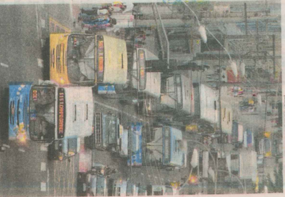
LEONARDO BICALHO - 17/08/2009

decoração, mobiliário e equipamentos são apenas sugestões, não sendo parte integrante do contrato de compra e venda. Imagens meramente ilustrativas.