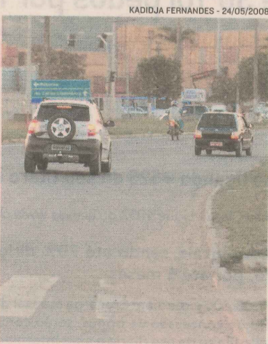
KADIDJA FERNANDES - 24/05/2008