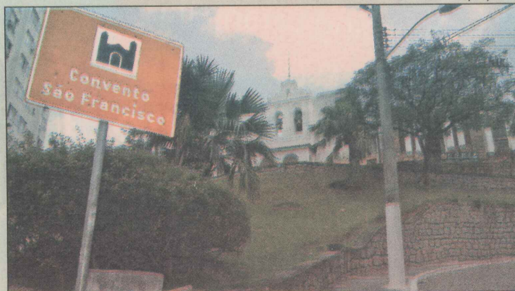
Monumentos históricos terão novos modelos de placas