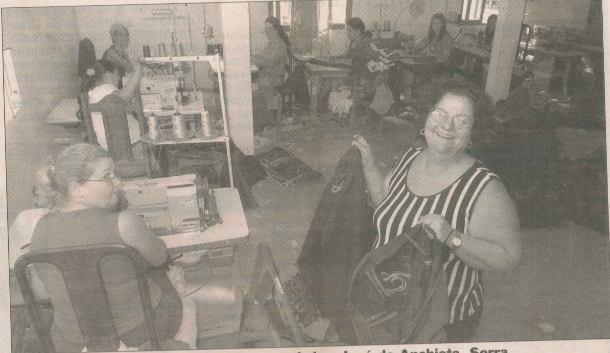
Confecção de calças jeans em fábrica no bairro José de Anchieta, Serra

URNA – Os moradores de José de Anchieta, na Serra, podem depositar por escrito suas reivindicações para melhorias no bairro e dicas de reportagens na urna do projeto A Tribuna com Você na Revistaria do Maia, na avenida Palmeiras.