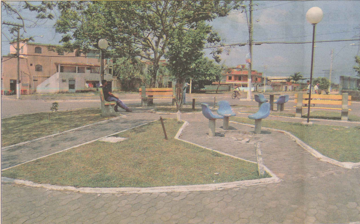
A praça é uma das principais opções de lazer do bairro José de Anchieta, na Serra