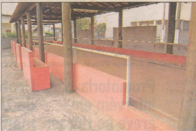
Campo de bocha localizado na associação