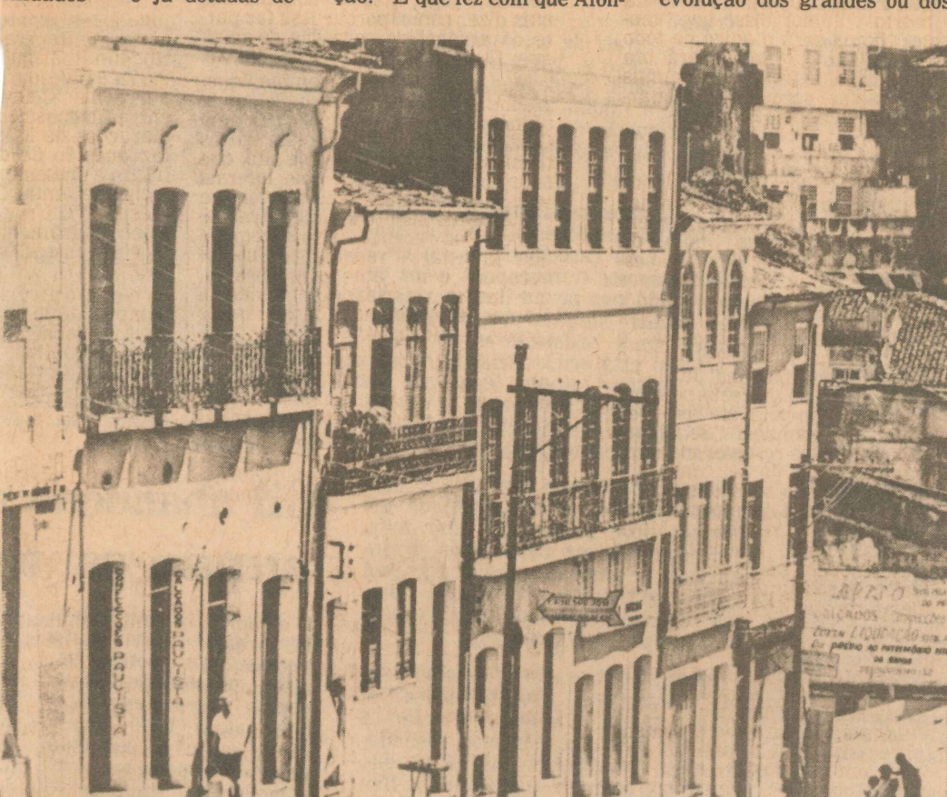
Os coloridos casarões coloniais da ladeira do Pelourinho são hoje atração turística em Salvador.

outras figuras das letras brasileiras de tempos recentes e de hoje. E que, tanto quanto nós outros, viveram em diferentes épocas a realidade urbana do Brasil e que foram personagens das cenas e dos dramas citadinos.