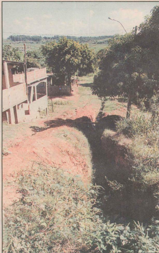
A maioria das ruas não é pavimentada. Na Paraná, esgoto corre a céu aberto