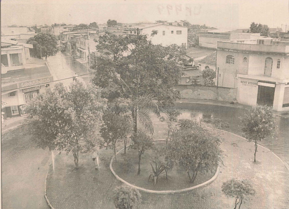
José de Anchieta é formado por um conjunto habitacional que surgiu em 1977

O bairro localizado na Serra será visitado pela equipe do projeto A Tribuna com Você durante a próxima semana