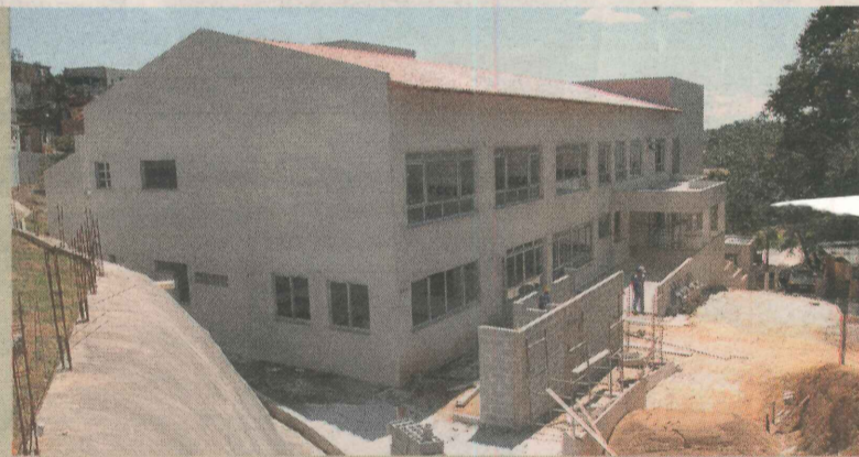
OBRAS DE AMPLIAÇÃO de creche: 12 salas de aula e outros espaços

metros), com rede de drenagem de toda a área, calçamento, calçadas, bancos pergolados, dragagem do canal, quadra de areia, quadra poliesportiva, playground, palco e iluminação pública.