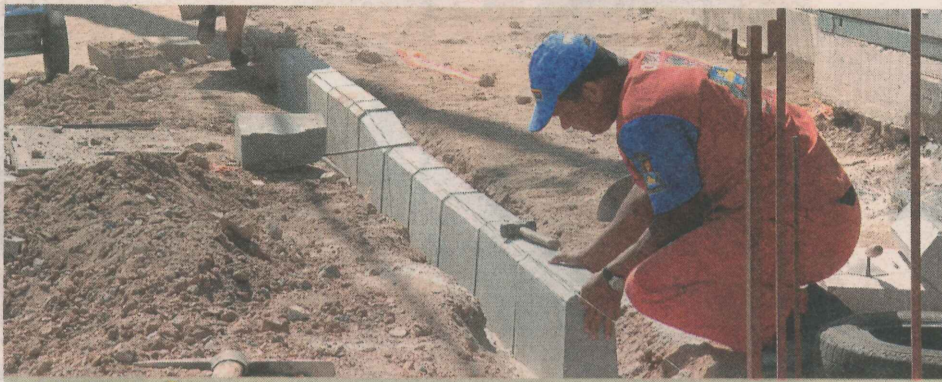
CONSTRUÇÃO de calçada e ciclovia na avenida Champagnat, na Praia da Costa

> IMPLANTAÇÃO de uma escola de educação infantil.