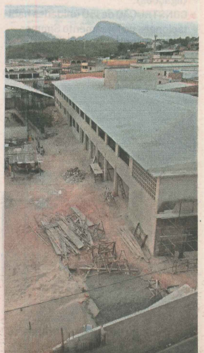
CONSTRUÇÃO de nova escola

> CONSTRUÇÃO da nova sede do Centro Municipal de Ensino Infantil Pastor Jocarli Alves Cardoso.