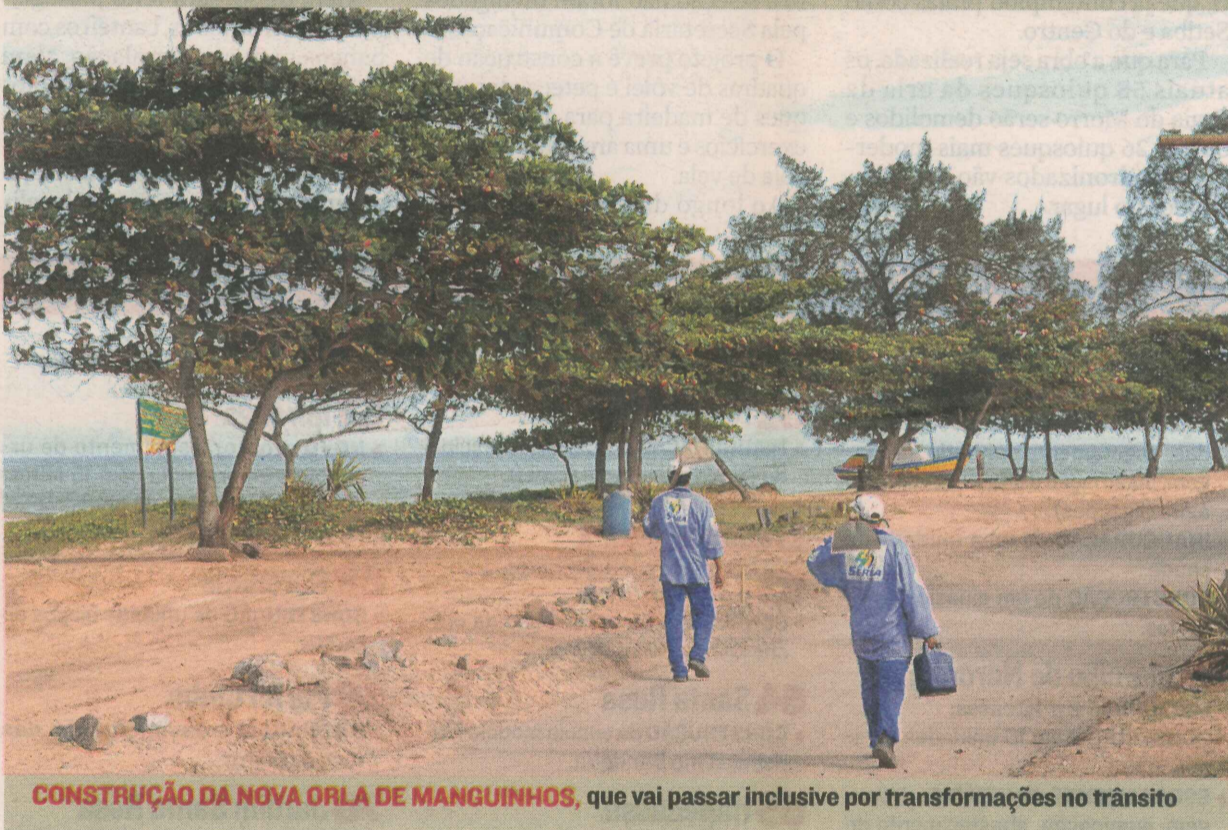
CONSTRUÇÃO DA NOVA ORLA DE MANGUINHOS , que vai passar inclusive por transformações no trânsito

> NO TRECHO SUL DA AVENIDA ATAPOÃ , da praça até o cruzamento com a rua Manoel Bermudes, haverá uma faixa destinada à recuperação da vegetação de restinga e será retirada uma pista hoje utilizada para automóveis.