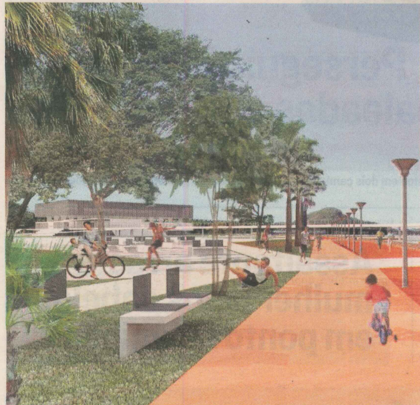
OBRAS DO PARQUE TANCRDÃO: ciclovia, pista de skate e mais atrações

“Esperamos que, até o final de 2010, 60% do município esteja com o esgoto tratado. Em algumas regiões, como Centro e Glória, chegará a 100%”, contou o prefeito Neucimar Fraga.