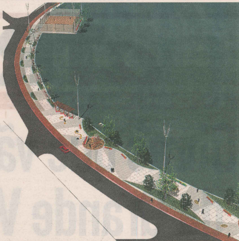
REURBANIZAÇÃO DA ORLA: lazer, rede de drenagem e calçamento