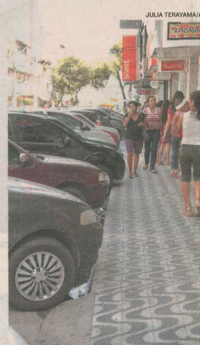
MAIS 400 VAGAS no rotativo

> RECAPEAMENTO da avenida Leila Diniz (vai beneficiar também o bairro Ilha dos Bentos).