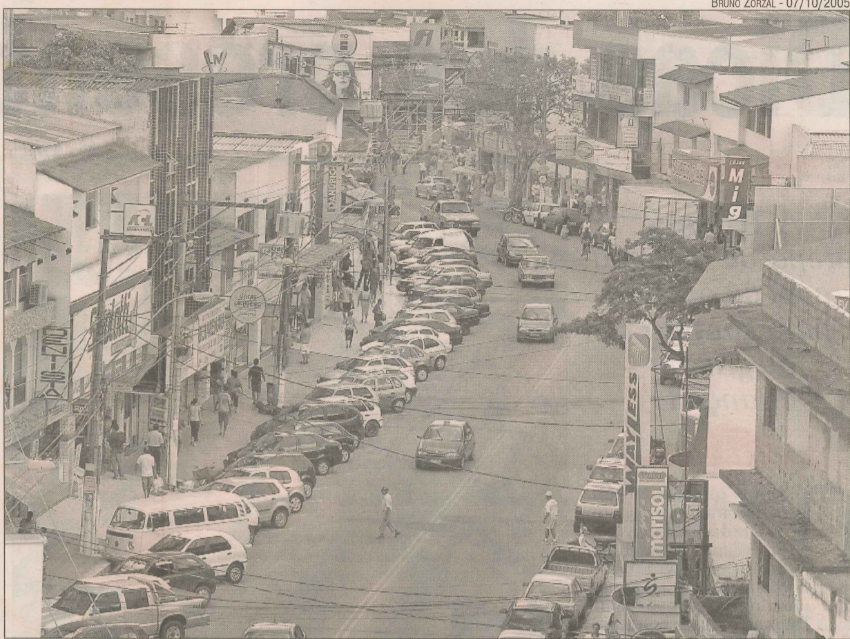
Vista da avenida Central, onde há variedade de lojas e imóveis são mais valorizados

Considerando que o futuro já chegou ao local, construtoras estão investindo em obras de luxo, como é o caso da Morar, que entrega este ano a primeira etapa de casas duplex do condomínio Aldeia dos Marabás, um conjunto com área de lazer, clube e campo de golfe, com custo médio de R$ 220 mil por imóvel.