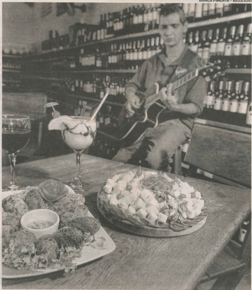
A ADEGA TIRA-TEIMA faz sucesso na noite de Laranjeiras, na Serra

points de Laranjeiras e já estamos em processo de ampliação para atender melhor nossos clientes”, disse.