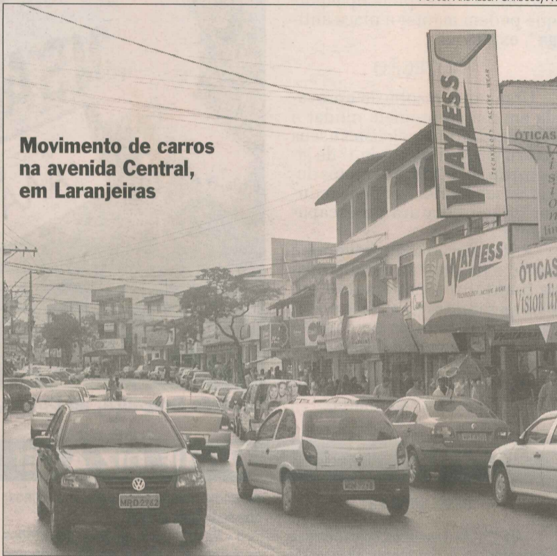
Movimento de carros na avenida Central, em Laranjeiras