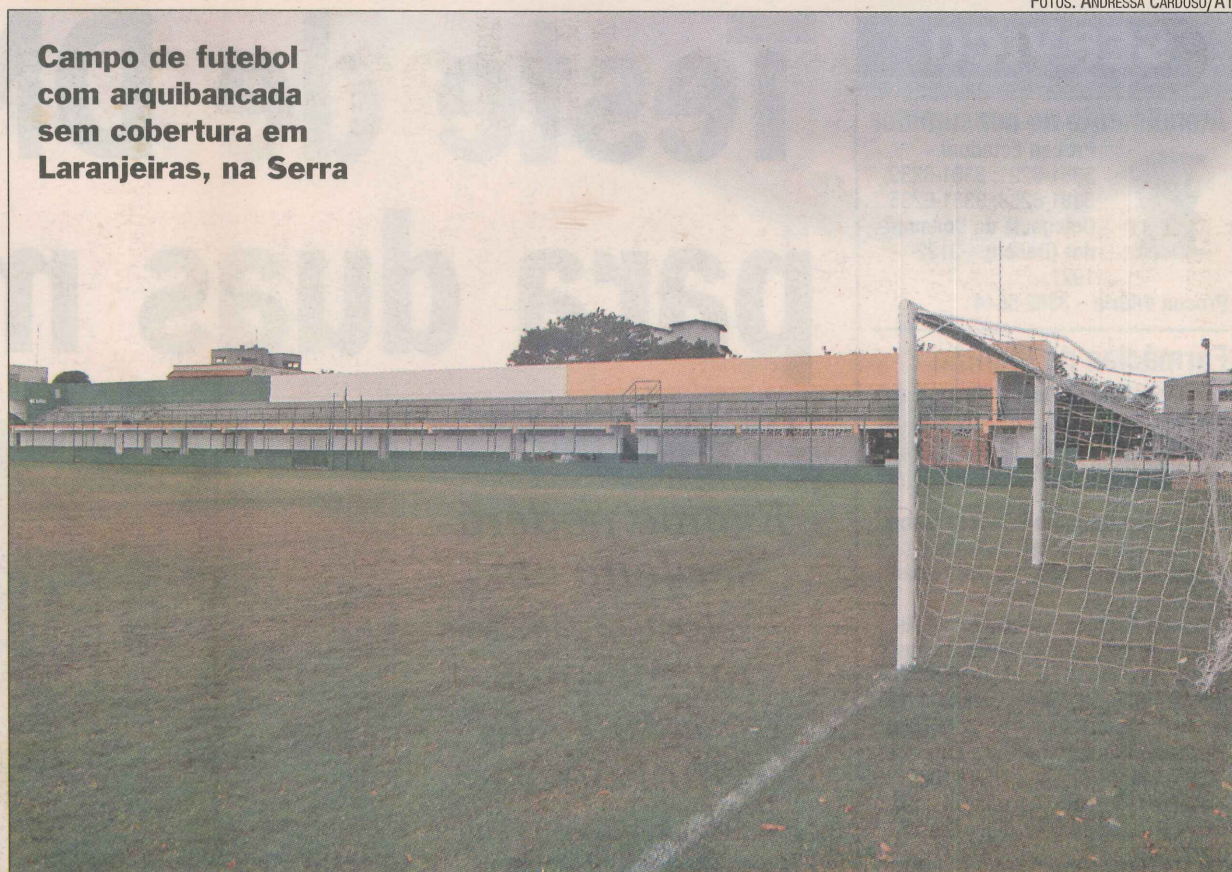
Campo de futebol com arquibancada sem cobertura em Laranjeiras, na Serra

O campo de futebol, chamado de Laranjão, foi fundado há 28 anos, mas sem a arquibancada, que só foi construída em 2002.