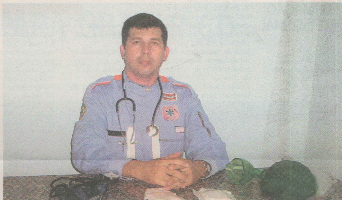
EVENTOS. A entidade mantém uma sala no Condomínio Residencial Carapina B1, onde são realizadas palestras para instruir a comunidade.

A entidade simula situação de acidentes e de incêndios e orienta como se deve agir nessas ocasiões, além de medir a pressão arterial das pessoas.