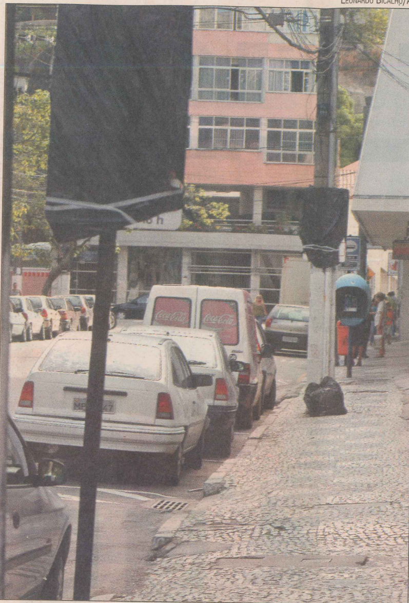
As placas de estacionamento rotativo já estão instaladas